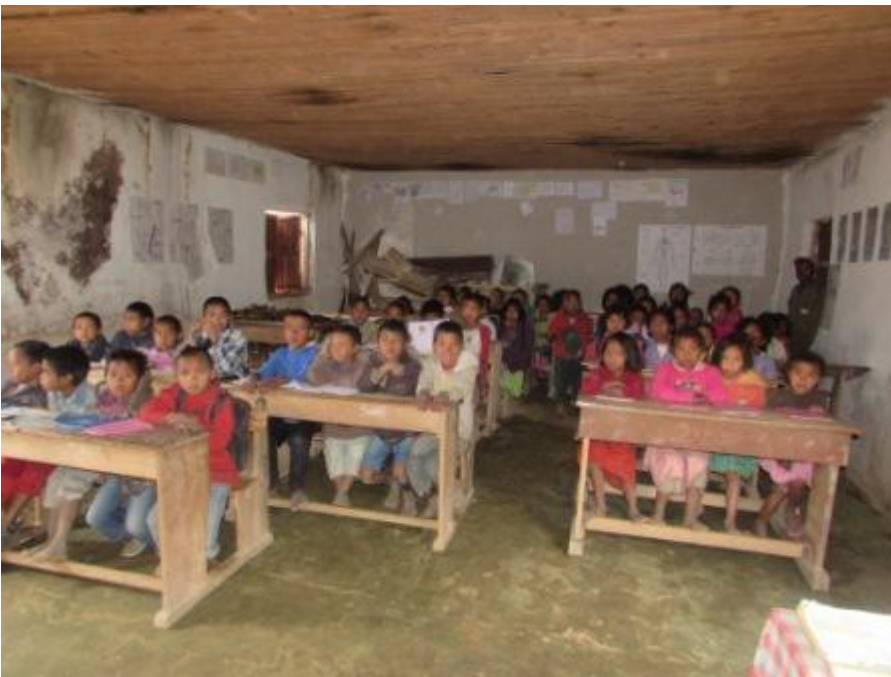
École primaire d'Analanakondro, commune d'Alakamisy.