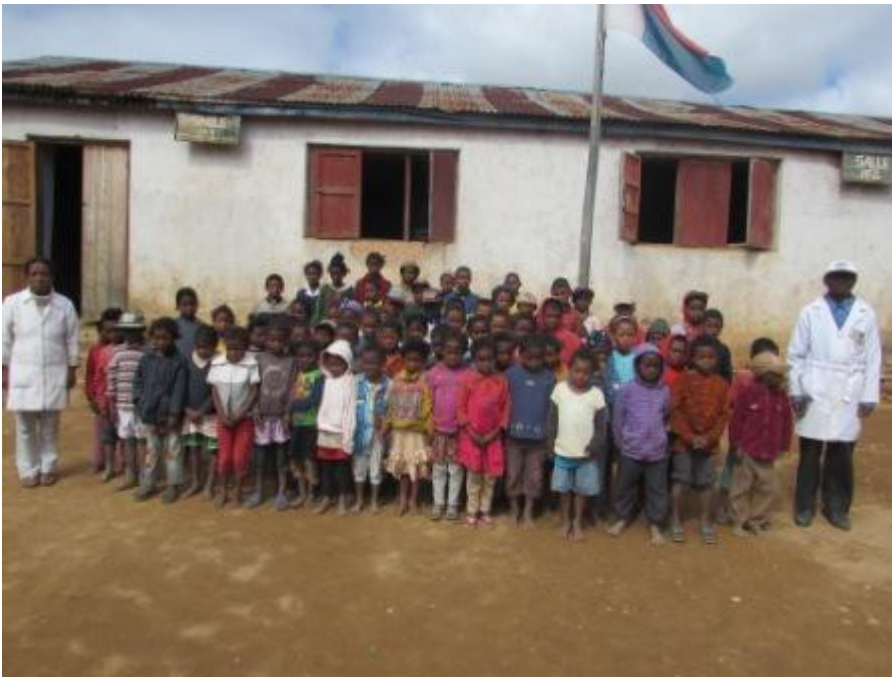
École primaire d'Analanakondro, salle de classe commune d'Alakamisy.