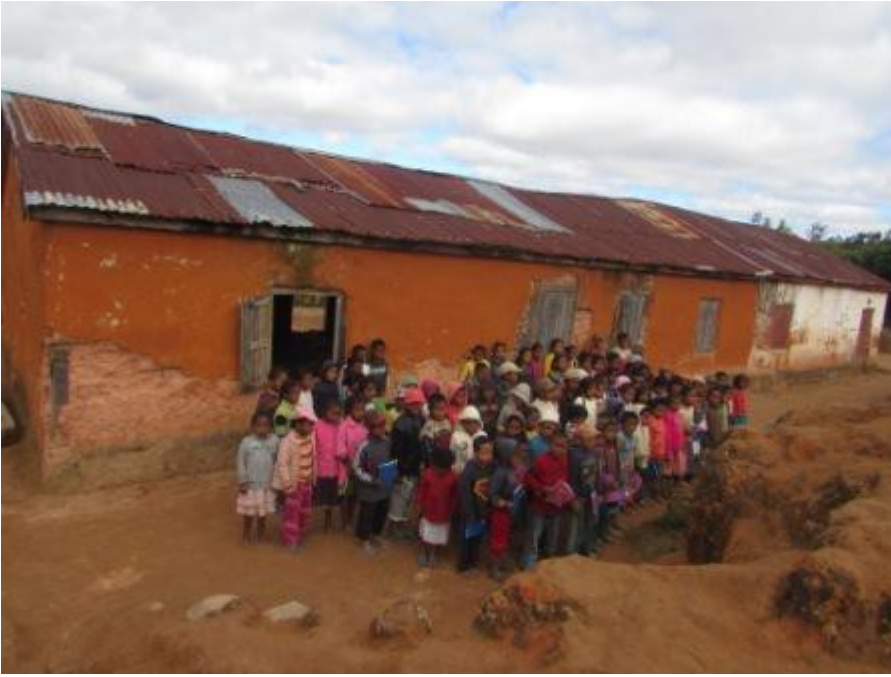
Une salle de classe de l'école primaire d'Andanona, commune de Tsarasaotra.